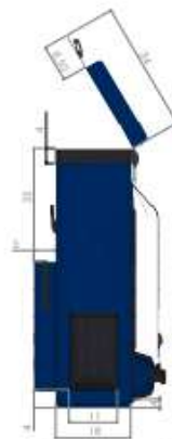
Vista lateral derecha