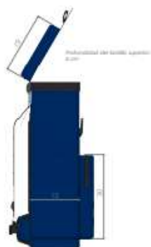
Vista lateral izquierda